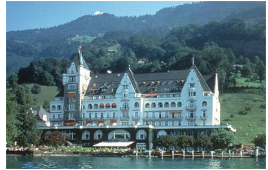
VEB-Frühjahrs-Intensivseminar im Park Hotel Vitznau Donnerstag, 26. April 2001 – Freitag, 27. April 2001