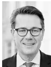
Beni Würth Ständerat Kanton St. Gallen, ehemals Regierungsrat und Präsident der Konferenz der Kantonsregierungen sowie Stadtpräsident Rapperswil-Jona